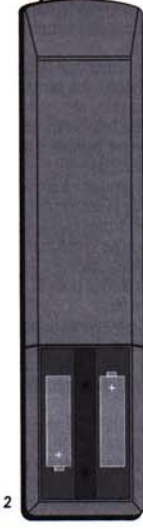
fig. 2 deckel batteriefach, zum auswechseln der batterien (2 batterien AAA 1,5 V) Copertura vano batterie (2 batterie AAA 1,5 V) chapa para el recambio de pilas (2 pilas AAA 1,5 V)