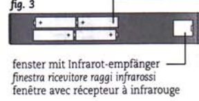
fig. 3 fenster mit Infrarot-empfänger / finestra ricevitore raggi infrarossi / fenêtre avec récepteur à infrarouge fig. 4 deckel batteriefach, zum auswechseln der batterien (4 batterien AAA 1,5 V) copertura vano batterie (4 batterie AAA 1,5 V) ventana con receptor de infrarrojos / tapa para el recambio de pilas (4 pilas AAA 1,5 V)